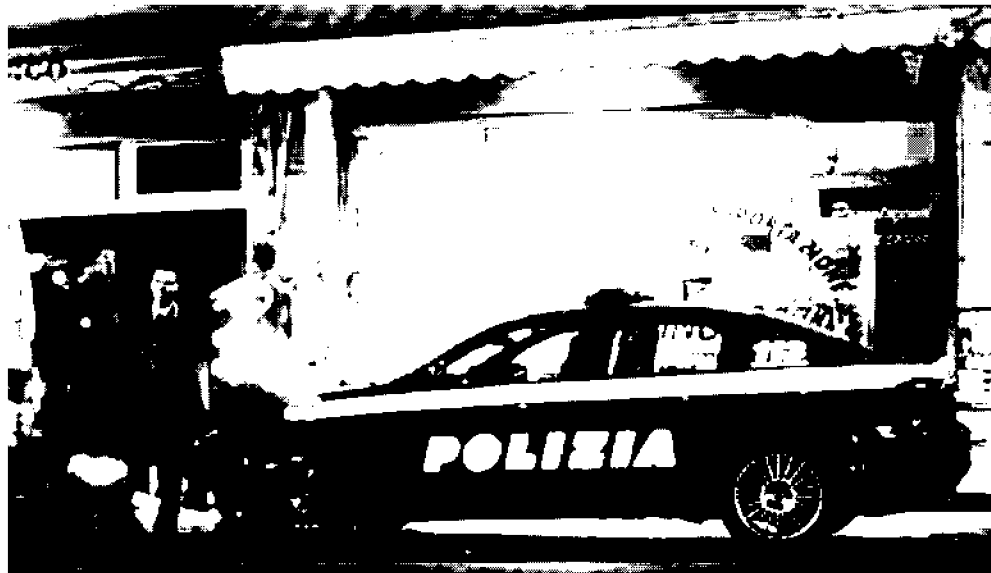
Guai notturni I poliziotti indagati di recente avrebbero dormito durante i turni serali

I sindacati organizzatori: «Sono molti più dei 22 accusati di dormire»