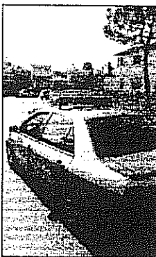
Una Volante della Polizia