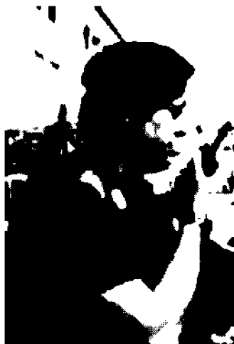
Un agente di polizia

«Il ministero ha tagliato d'autorità il 50% del dovuto. Presenteremo ricorso»