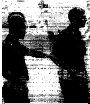
Agenti della Polizia a Jesolo

I lavori potrebbero essere assegnati il prossimo autunno. L'edificio resterà di proprietà comunale