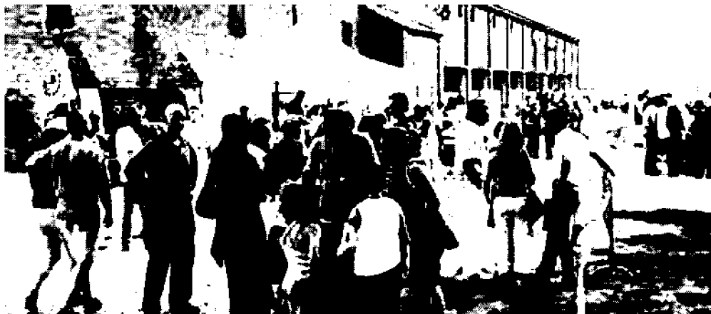
Serata Gli ospiti della festa organizzata a Trecenta in solidarietà ai poliziotti indagati

In 300 alla cena. E l'onorevole leghista accusa: inchiesta gestita male